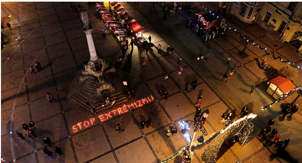
Jedna z prvých aktivít platformy Nie v našom meste: vytvorenie nápisu „Stop Extrémizmu“, námestie v Banskej Bystrici, 2013

V roku 2014 prišla ďalšia výrazná zmena. Najdlhšie trvajúca a najúspešnejšia iniciatíva zo Zvolena spolu s expertami z CKO začala kampaň za svoj vlastný komunitný priestor, ktorá neskôr vyústila do otvorenia úplne prvého občianskeho centra v Banskobystrickom kraji, nazvanom OKO - Občianska komunitná obývačka .