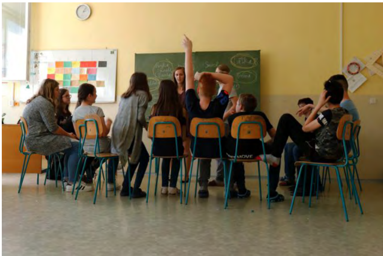
Vzdelávací program Školy za demokraciu, 2017

Táto profesionalizácia vyformovala nosnú časť aktivít Centra komunitného organizovania a dala riadne uznanie organizácii, a to najmä po úspechu regionálnej kampanie Spolu je nás viac (Together there are more of us) v roku 2017. Vďaka nej sa podarilo poraziť pravicovo-extrémistické líderstvo v krajských voľbách.