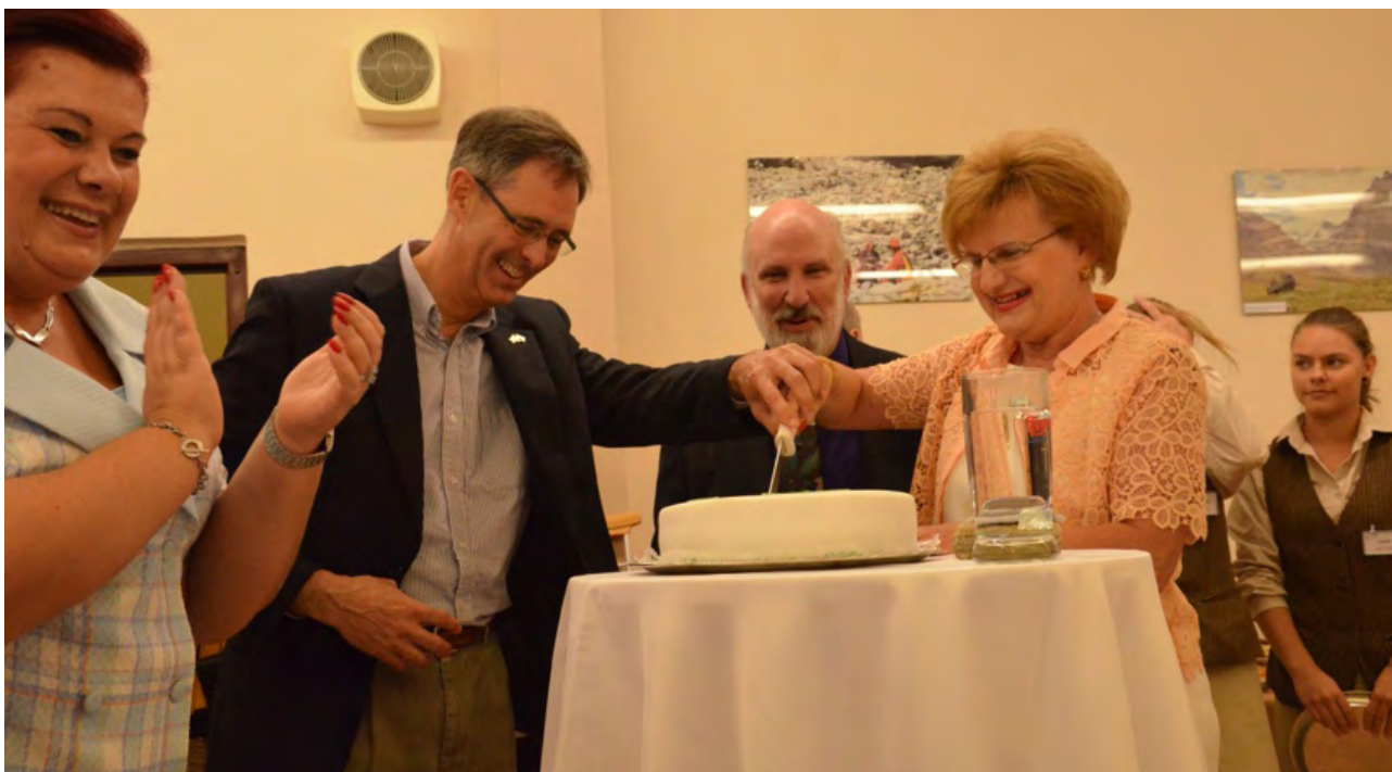
Otvorenie Občianskeho centra OKO vo Zvolene na sídlisku Západ, 2014

V roku 2014 prišla ďalšia výrazná zmena. Najdlhšie trvajúca a najúspešnejšia iniciatíva zo Zvolena spolu s expertami z CKO začala kampaň za svoj vlastný komunitný priestor, ktorá neskôr vyústila do otvorenia úplne prvého občianskeho centra v Banskobystrickom kraji, nazvanom OKO - Občianska komunitná obývačka .