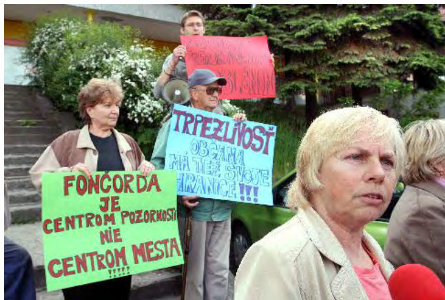
Občianska iniciatíva Podlavice, Banská Bystrica a kampaň proti výstavbe výškovej budovy investorom, 2008

Všetka táto snaha pomohla nie len zvýrazniť hlas občanov, ale bola tiež zásluhou pri vytvorení siete aktívnych občanov, ktorí navzájom podporovali svoje kampane. Tým sa im podarilo sformovať silnú, prepojenú a rešpektovanú komunitu občanov, ktorí sa starajú o zlepšenie svojho okolia a prostredia. Toto malo dôležitý vplyv na budúcnosť organizácie.