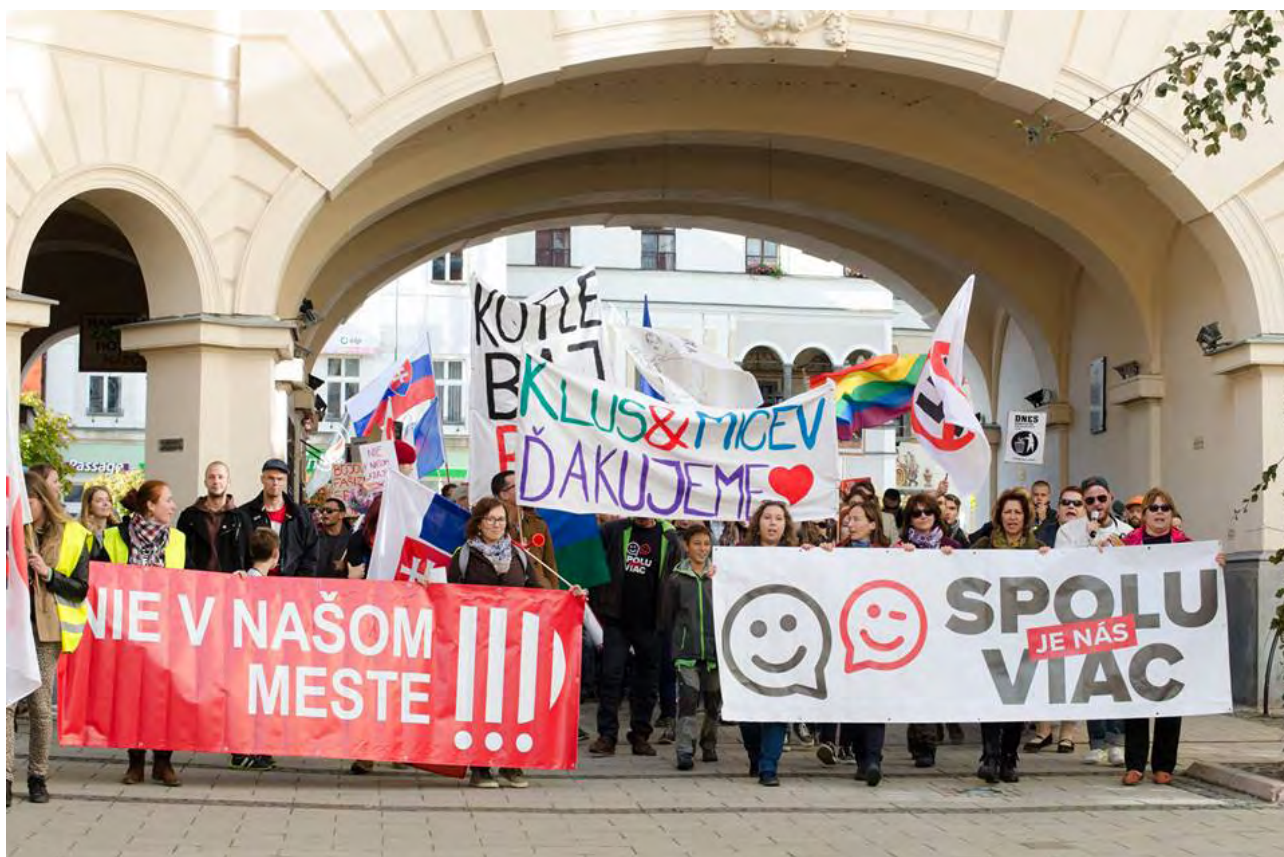
Protiextremistický protest, október 2017

Na záver, tesne pred krajskými voľbami, traja hlavní a najsilnejší demokratickí kandidáti sformovali koalíciu. Zhodli sa na jednom lídrovi, najsilnejšom kandidátovi, ktorý sa stal lídrom vo voľbách proti extrémistickému kandidátovi.