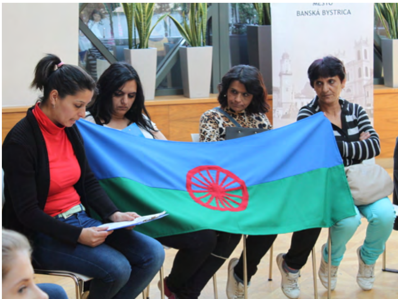
Rómske líderky počas zdieľania svojich príbehov, 2018

Aj programu Komunitné organizovanie sa podarilo zvýšiť profesionalitu a zamerať sa viac na zapojenie zraniteľných a marginalizovaných skupín. CKO začalo investovať do komunitného organizovania v rôznych rómskych znevýhodnených komunitách so zameraním na silné ženské líderstvo.