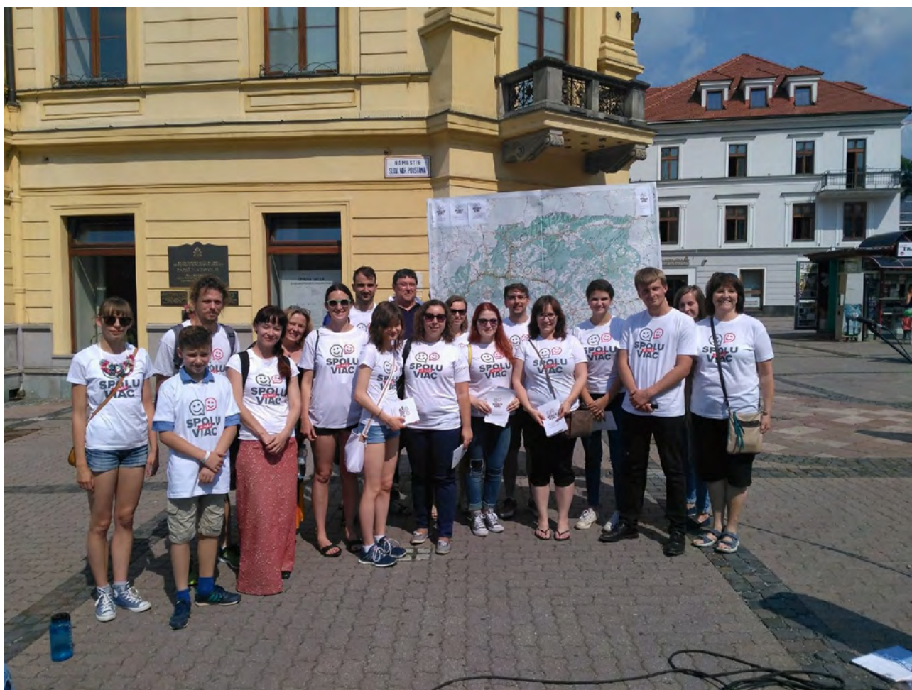
Spustenie kampane Spolu je nás viac v máji 2017

Platforma NIOT naplánovala kampaň s veľkou presnosťou. Bola mimoriadne citlivá v tom, že boli vypočuté a rešpektované všetky hlasy. Regiónu preto dávala nádej, že sa niečo podobné môže nakoniec stať aj na národnej úrovni.