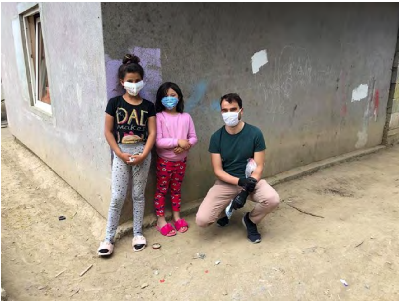
Dobrovoľníci z majority pomáhali deťom so vzdelávaním

Bez zapojenia mnohých lokálnych inštitúcií a mimovládnych organizácií, ktoré sa do tohto úsilia zapojili pro bono, by celá táto pomoc nebola možná.