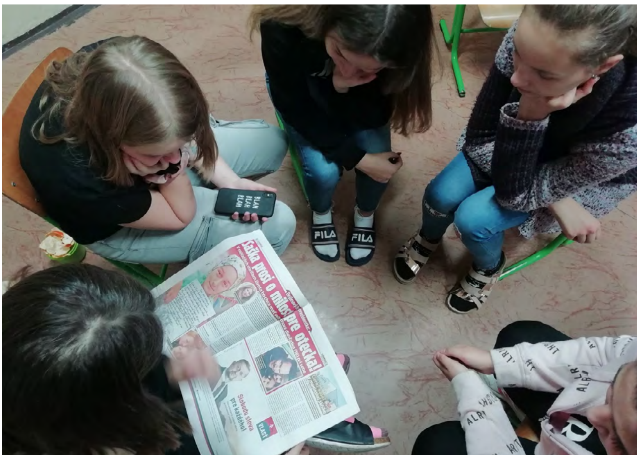
Program Školy za demokraciu

Nebolo prekvapením, že druhý rok sa do programu pridalo 15 škôl, tretí rok bolo v programe až 27 škôl a vo štvrtom roku ich bolo viac 30.