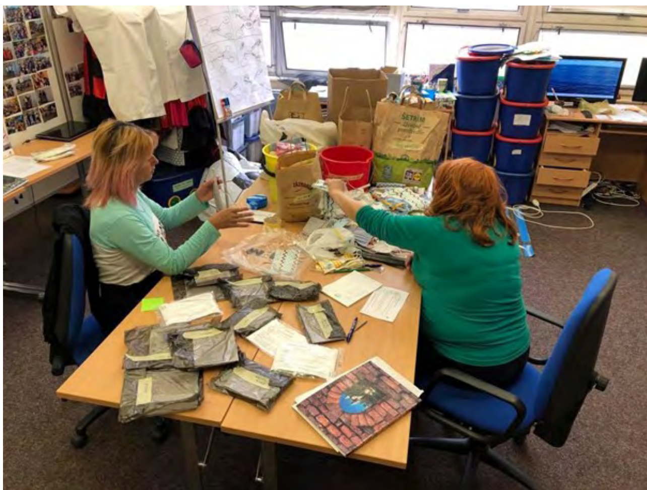
Zbierka hygienických potrieb pre komunitu

Ohlas verejnosti bol veľký. V rámci materiálnej pomoci sme počas prvej vlny distribuovali 518 ochranných masiek, 475 uterákov, 40 litrov dezinfekčného gélu a 560 kusov mydla. Špeciálnu pozornosť sme venovali 17 rodinám bez prístupu k pitnej vode, ktorým sme poskytli 20 bandasiiek na vodu, 35 vedier, 27 lavórov, 200 kusov toaletného papiera a podobné množstvo papierových uterákov.