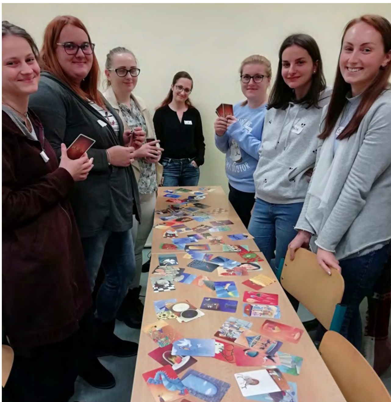
Program Školy za demokraciu