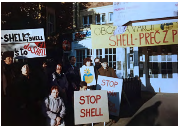
Občianska iniciatíva – Radvaň, Banská Bystrica a ich kampaň proti spoločnosti Shell a benzínovej pumpe v obytnej zóne, 2005

Odvtedy CKO pomáha rôznym občianskym iniciatívam a komunitám po celej krajine, no najviac v mestách Zvolen a Banská Bystrica. V období rokov 2000 až 2012 bolo CKO koordinátorom rôznorodých miestnych kampaní od ochrany zelených oblastí, opravu ciest, tvorbu ihrísk pre deti alebo aj protestov proti veľkým developerským zámerom.